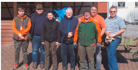
Ein Teil der Helfer mit Traktor und Hänger im Grünauer Hof