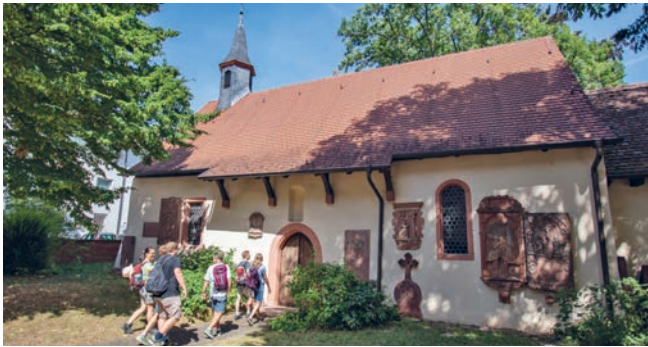
Die Peterskapelle, ein Baudenkmal von regionaler Bedeutung

Vor langer Zeit – so fangen normalerweise Märchen an – wurde das Frankenland christianisiert. In Tauberbischofsheim missionierte der hl. Bonifatius, auch als „Apostel der Deutschen“ verehrt, und gründete um etwa 735 das erste deutsche Frauenkloster, das seine Nichte, die hl. Lioba als Äbtissin führte. Seit 1945 wird in Tauberbischofsheim das Liobafest als Stadtfeiertag am letzten Samstag im September gefeiert, außerdem wurde der Stadtpatronin die Kirche am Marktplatz, eine ehemalige Klosterkirche, erbaut 1650, geweiht. Die Pfarrkirche St. Bonifatius im Osten der Gemeinde, erbaut ab 1964, beeindruckt besonders mit seinen Kirchenfenstern, die als Bleiverglasung ausgeführt sind. Weitere Gotteshäuser prägen das Stadtbild, so die kath. Stadtkirche St. Martin, erbaut ab 1910, die u.a. mit wichtigen Kunstgegenständen aus den drei Vorgängerkirchen ausgestattet ist. Die Maria-Hilf-Kapelle in der oberen Fußgängerzone aus dem Jahr 1700, die Sebastianuskapelle, eine Doppelkapelle, deren Untergeschoss früher als Beinhaus diente und im Eingang eine Darstellung des Jüngsten Gerichts aufweist, die Peterskapelle, der älteste Kirchenbau der Stadt aus romanischer Zeit, ein Kulturdenkmal erbaut um 1180 und last but not least die ev. Christuskirche, erbaut ab 1894 im neugotischen Stil. Auch in den sechs Stadtteilen gibt es sehenswerte Gotteshäuser und auf der gesamten Gemarkung zeugen zahlreiche Flurdenkmale und Wegkreuze von einer bewegten Vergangenheit.