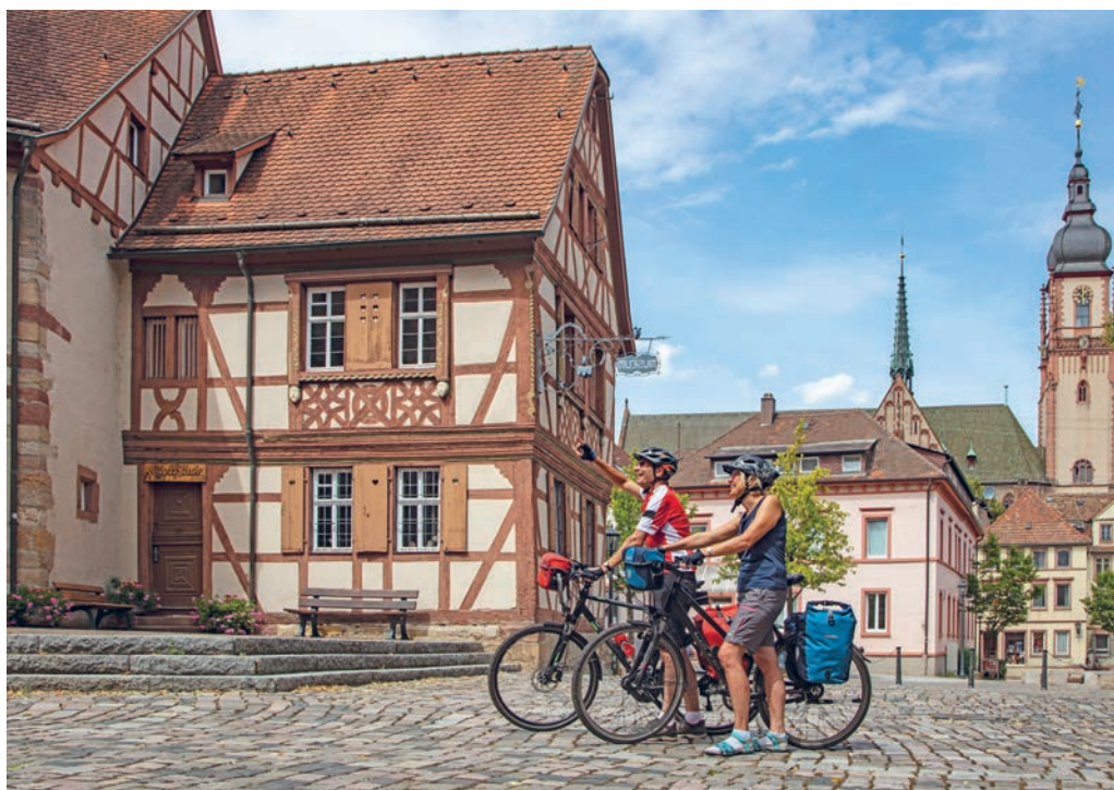
Der Radweg "Liebliches Taubertal - der Klassiker" führt von Rothenburg ob der Tauber durch Tauberbischofsheim bis Wertheim und ist seit November 2009 durch den ADFC mit fünf Sternen ausgezeichnet.

„Ausgezeichnet werden die fahrradfreundlichsten Städte und Gemeinden nach vier Einwohner-Größenklassen sowie diejeni-