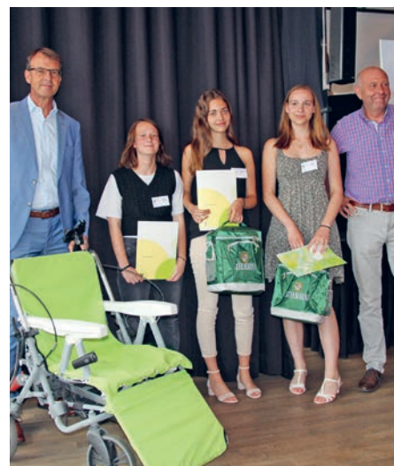
Der „Rolligolli“ ist eine verbesserte Version eines Rollators.

Das Bild unten zeigt eines der Preisträgerteams und ihre Unterstützer von 2022 mit dem „Rolligolli“: